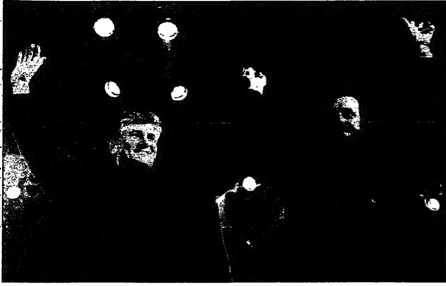
زعماء المعارضة الصربية تظاهروا في بغداد بمناسبة الاحتفالات برأس السنة الأوروغرافية (رويت)

بغداد - ولحقت - وولات جمت لتظاهرة الصربية لتلافي الأمل في جمع أكبر تظاهرة في بغداد، شارك فيها أكثر من 500 ألف شخص، للاحتفال بعيد رأس السنة الأوروغرافية، والتعبير عن مواقفهم من الأوضاع السياسية والاقتصادية في بلادهم. وشارك في التظاهرة قادة المعارضة الصربية وعلى رأسهم زعيم المعارضة فيليب بويكوفيتش. وقد حضر التظاهرة ممثلون عن القوى السياسية المختلفة، وكذلك ممثلون عن المجتمع المدني والهيئات الطلابية والنسائية. وتعد هذه التظاهرة من أكبر التظاهرات التي تشهدها بغداد منذ سنوات طويلة. وحظيت التظاهرة باهتمام كبير من وسائل الإعلام المحلية والعالمية، حيث نقلت القنوات الفضائية أحداثها على مدار الساعة. وتعد هذه التظاهرة انعكاساً لمرارة الشعب الصربي تجاه الوضع السياسي والاقتصادي في بلادهم، وكذلك تجاه سياسة الرئيس يوشكو فيليب بويكوفيتش. وتعد هذه التظاهرة أيضاً فرصة للشعب الصربي للتعبير عن مطالبه الإصلاحية، وللمطالبة بتغيير النظام الحاكم في بلادهم.